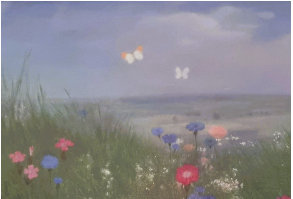
Detail aus: G.Wimmer, Steine, Blumen, Schmetterlinge (1939)

Borstel-Hohenraden, Kummerfeld und Prisdorf